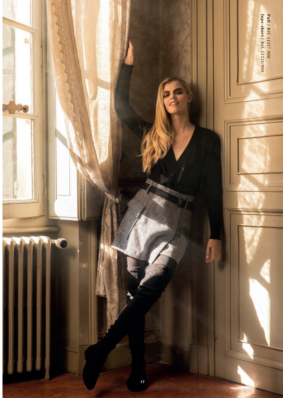
Pull / Réf. 11217/900 Jupe-short / Réf. 11223/900