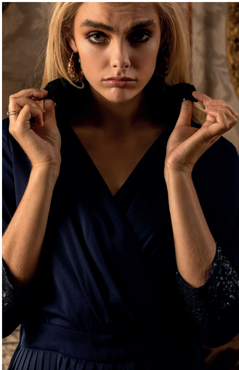
Combishort / Réf. 11228/600