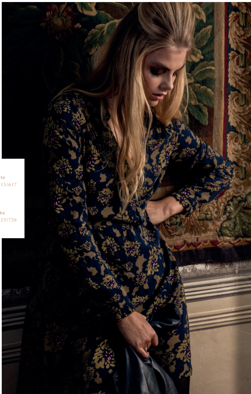
Veste Réf. 11215/617