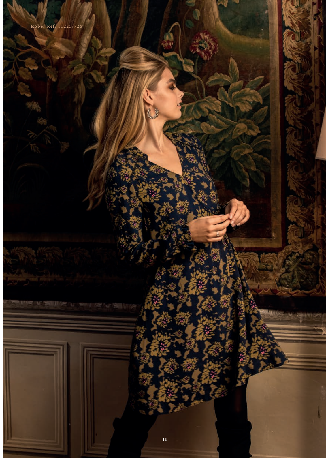
Robe/ Réf. 11225/726