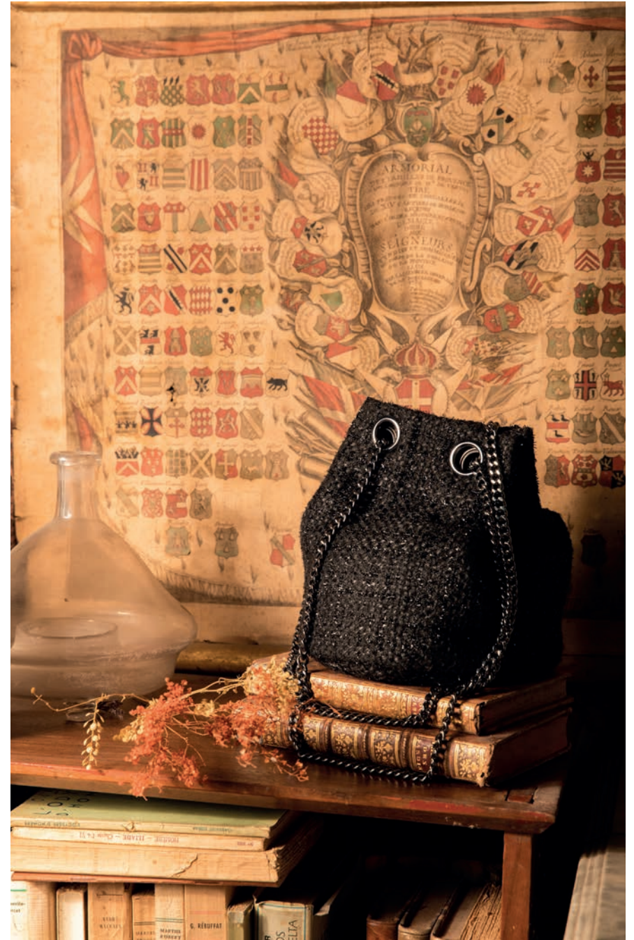
Sac / Réf. 90305/900